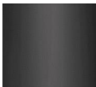
Nero Black RAL 9017