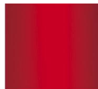
Rosso Red RAL 3002