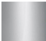
Grigio Grey RAL 9006

Het doel hiervan is om bij intens gebruik de temperatuur in de molen laag en constant te houden. Verhoging van temperatuur is namelijk nefast voor de aroma's.