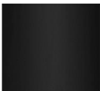
Nero Opaco Matt Black RAL 9017